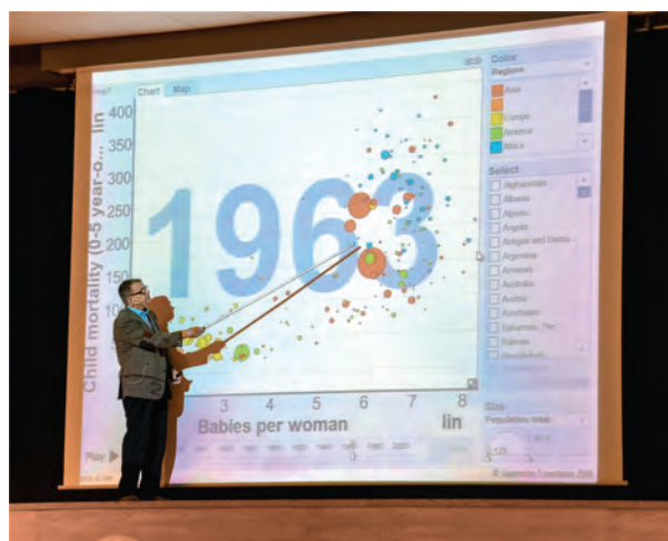
Hans Rosling invigningstalar i ämnet global hälsa