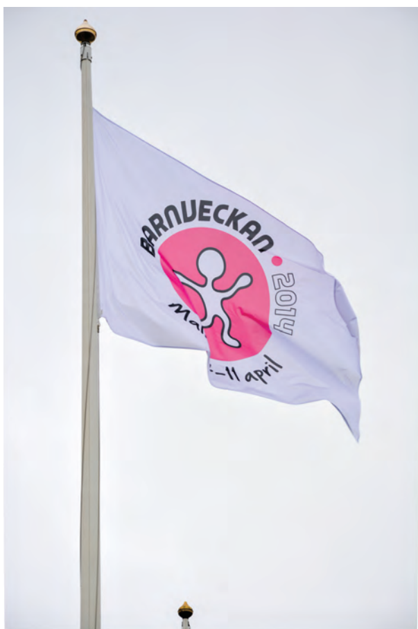
Flaggan i topp för Barnveckan

Temat “Jämlig vård – lokalt, nationellt och internationellt” illustrerades bla med en mycket inspirerande och hoppande föreläsning av Hans Rosling, med en mycket uppskattad kurs i “Barnsjukvård i ett globalt perspektiv” och med en väldigt engagerande eftermiddag om “Jämlig hälsa” då bla Malmökommissionens rapport presenterades och diskuterades. Att få höra författaren till Jämlikhetsanden, Richard Wilkinson, på länk från Nottingham var riktigt kul!