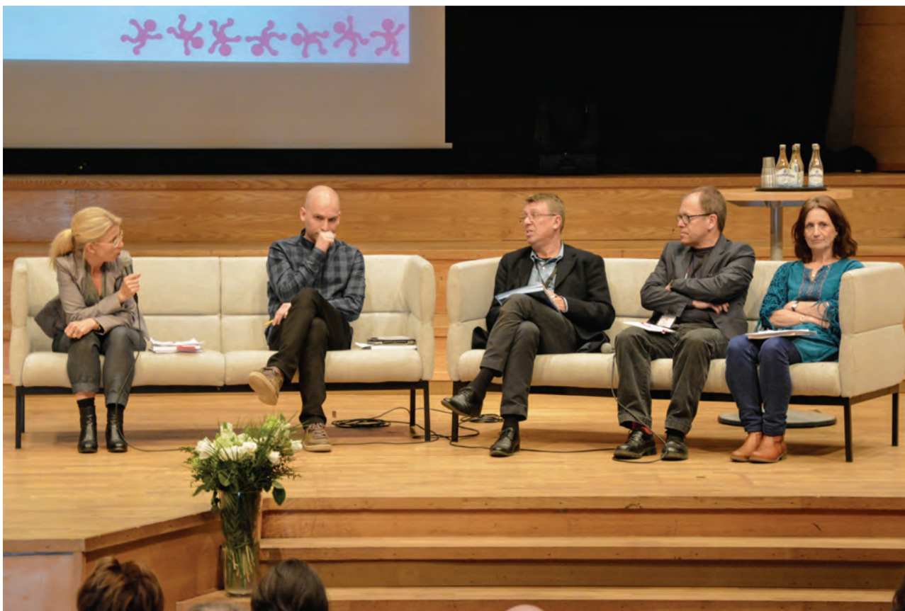
Koncentration och pannoner i djupa veck under paneldebatt på temat jämlik hälsa