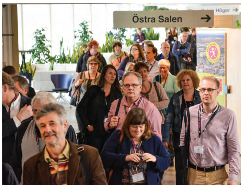
På väg mellan föreläsningssalarna