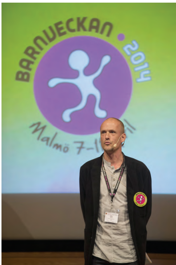
Kongressgeneral Petter Borna inviger Barnveckan