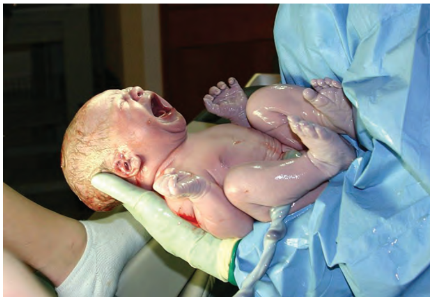
Nyfött barn - ett antal nyfödda barn drabbas varje år av kramper.

Neonatala kramper drabbar cirka två per tusen nyfödda barn i Sverige. Kramper hos nyfödda är oftast orsakade av föregående "insulter", t ex asfyxi, stroke, hypoglykemi, hjärnblödning, och infektion, medan epileptiska syndrom är mer ovanliga.