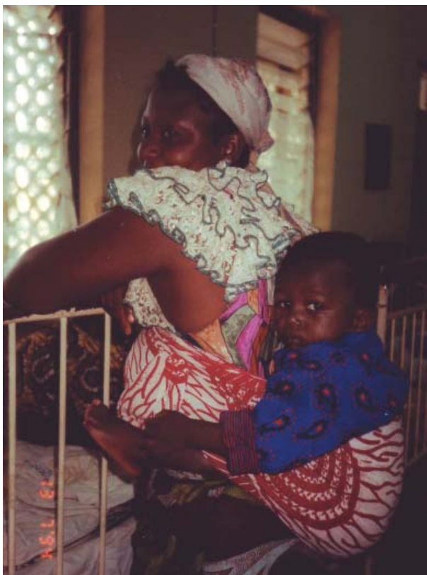
Det var trångt i barnsalen. De sjuka barnen hade alltid sällskap av mammor och syskon.