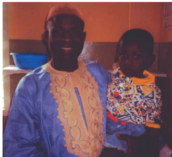
Patienter och deras anhöriga visade alltid stor tacksamhet över den vård de erbjöds. Överhuvudtaget slogs av jag den stora livsglädje jag mötte hos många människor i Västafrika.

Malaria var mycket vanligt. Diagnostiken ställdes med sjukhusets enda mikroskop.